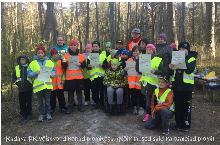
Kadaka PK võistkond kohadiplomitega. (Kõik lapsed said ka osalejadiplomi).

Šuur aitäh kõigile osalejatele ja kohtunikele!